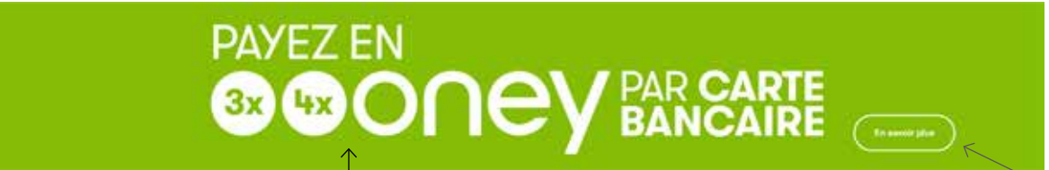
Bloc logo produit 3x 4x Oney